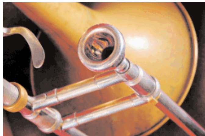
De l'embouchure au pavillon, le trombone est fabriqué en cuivre jaune ou nickelé.