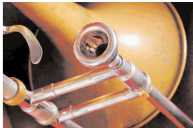
De l'embouchure au pavillon, le trombone est fabriqué en cuivre jaune ou nickelé.